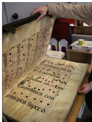
(Spansk praktverk fra 1500-tallet)