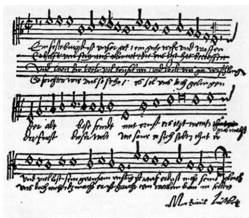
(Luthers manuskript: Vår Gud han er så fast en borg)

Utviklingen snudde på 1500-tallet. Calvin startet gjendiktning av hele psalteret, som var på prosa, til salmer med vers på rim (poesi), og med enkle, rytmiske melodier. Så kunne vanlige folk igjen være med å synge de bibelske salmene. Luther ble begeistret og bidro f.eks. med Ps 46 til «Vår Gud han er så fast».