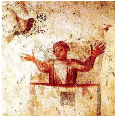
Katakombemaleri av bedende Noa

I 1 Tim nevner apostelen ulike typer bønner. Oppfordring til bønn går som en tråd gjennom hans brev. Forbønnen er altså den som har sin plass her. De andre bønnene er kollektbønnen på den enkelte søndag og fremfor alt evcharistibønnen, nattverdbønnen. Likeledes inneholder hymnene vi bruker både takksigelser og påkallelser. På den måten oppfyller kirken i sine beste stunder sitt apostoliske kall.