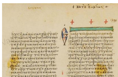
Bibelmanuskript Vaticanus fra ca 350

Den gammeltestamentlige lesningen kommer først. Det leses både fra Loven og Profetene (den jødiske Torah, Nevi'im og Ketuvim; her hører også De deuterokanoniske skriftene med). Før den nytestamentlige lesningen synges en gradualsalme, med tekster fra Salmenes bok. At Salmenes bok utgjør så å si bindeleddet mellom GT og NT gir en dyp mening, for i den bibelske bønneboken ber Menneskesønnen på vegne av hele menneskeslekten. Jesus sier selv at også Salmene handler om ham (jfr. Luk 24,44). Det er lang tradisjon for at den andre lesningene (fra Det nye testamentets brever, Apostlenes Gjerninger og Johannes Åpenbaring) leses av subdiakonen, dersom slik finnes.