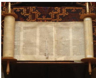
Gammel italiensk Torah-rull, i bruk

Den gammeltestamentlige lesningen kommer først. Det leses både fra Loven og Profetene (den jødiske Torah, Nevi'im og Ketuvim; her hører også De deuterokanoniske skriftene med). Før den nytestamentlige lesningen synges en gradualsalme, med tekster fra Salmenes bok. At Salmenes bok utgjør så å si bindeleddet mellom GT og NT gir en dyp mening, for i den bibelske bønneboken ber Menneskesønnen på vegne av hele menneskeslekten. Jesus sier selv at også Salmene handler om ham (jfr. Luk 24,44). Det er lang tradisjon for at den andre lesningene (fra Det nye testamentets brever, Apostlenes Gjerninger og Johannes Åpenbaring) leses av subdiakonen, dersom slik finnes.