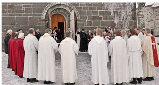
De utsendte på kirkebakken på Granavollen

Den indre sammenheng mellom alterbrødet og kristenlivet vil vi illustrere ved å ta utgangspunkt i den første nedfelte skildring av disiplenes bordfellesskap med Jesus. I Markusevangeliet leser vi at Jesus etter å ha kalt de tolv og talt til en stor mengde, trekker seg tilbake for å spise, men, leser vi: "da kom Jesu mor og hans brødre; de ble stående utenfor, men sendte bud og bad ham komme ut. En stor flokk satt omkring ham, og noen sa til ham: "Din mor og dine brødre er utenfor og spør etter deg." Han svarte: "Hvem er min mor og mine brødre?" Og han så på dem som satt omkring ham, og sa: "Se, her er min mor og mine brødre! Den som gjør Guds vilje, er min bror og søster og mor." (Mark 3,31-34) Slik utfordrer Jesus de til stedeværende ved å forkynne det frembrytende Guds Rike. Scenen skjeler på denne måte mellom dem som er utenfor og dem som er nær. For å tydeliggjøre hva det vil si å være Jesus nær, understreker Markusevangeliet at et liv som Jesu disippel innebærer de utfordringer og anstrengelser som følger med det å være med ham på veien til Jerusalem (Mark 8,3.34). Som et ekko av dette omtales i Apostlenes gjerninger det å være kristen som ensbetydende med å "tilhøre veien" (Apg 9,2; 18,25; 24,22).